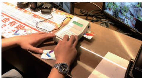
桌上型充值機 管理人員手動進行充值