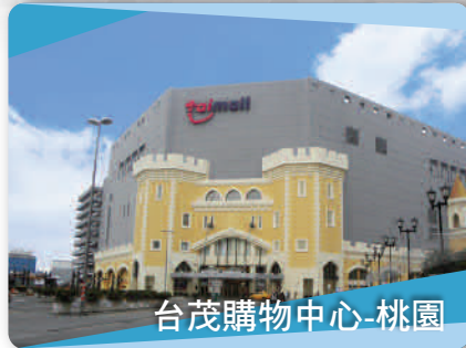
台茂購物中心-桃園