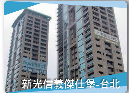
新光信義傑仕堡-台北